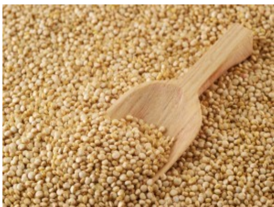
Figura 4: Aquênios de quinoa (vulgarmente denominados “sementes”) expostos à venda. Disponível em: http://www.imagens.google.com.br . Acesso em: 15 ago. 2011.

A quinoa vem sendo há anos introduzida na alimentação animal, principalmente bovina, por ter um equilíbrio nutricional considerado ótimo, se igualando à soja, e por ser uma fonte rica em ácidos graxos essenciais, sendo os mais importantes o linoléico ( \omega -6) e o linolênico ( \omega -3) (SPEHAR, 2006).