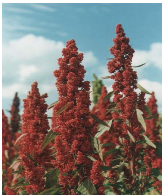
Figura 3: Inflorescências de quinoa ( Chenopodium quinoa ) em detalhe.

A quinoa ( Chenopodium quinoa Willd.) é uma planta de porte herbáceo-arbustivo, pertencente à família Amaranthaceae e que pode alcançar até, aproximadamente, 2,0 m de altura, apresentando um caule verde e ereto que pode ou não ser estriado. Suas inflorescências são terminais, com cerca de 45 cm de comprimento, diversificando a coloração quando atingem o amadurecimento (Figura 3). Seus frutos do tipo aquênio podem ter coloração branca ou amarela (Figura 4). São cilíndricos e achatados, envolvidos por um perigônio de cor verde. Internamente, possuem uma semente com cerca de 1,5 mm de diâmetro. Por constituírem o material colhido, esses frutos são frequentemente denominados “sementes”(FIGUEROA, 2006; SPEHAR & SANTOS, 2002; SPHEAR et al. 2003; BHARGAVA et al. , 2006).