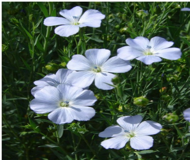
Figura 1. Flores do linho ( Linum usitatissimum ) em detalhe.

Encontrado, originalmente, na Ásia e na Europa, o linho tem sido cultivado há milênios pelo povo da Mesopotâmia, atual Iraque. Seu cultivo era, principalmente, destinado à produção de óleos e fabricação de ração animal, sendo comercializado, nesse caso, na forma de farelo, tendo sido também muito utilizado na alimentação humana. Também é muito utilizada na indústria de tingimento de tecidos (DUARTE, 2010; FERNANDES, 2009; MARQUES, 2008).