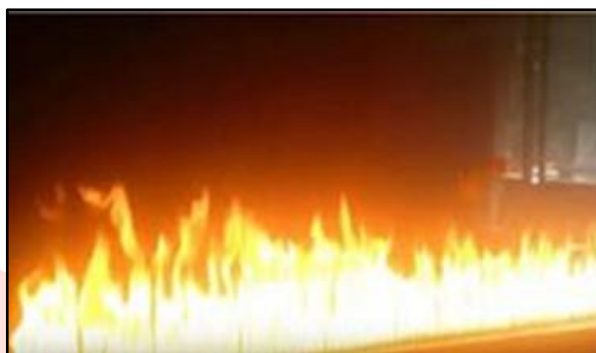
Figura 4: Tubo de Rubens

Na continuidade, foi mostrado o experimento “Tubo de Rubens”, produzido pelo Laboratório de Física da Universidade de Passo Fundo (UPF). O objetivo foi o de explicar, de forma experimental, as ondas sonoras. O vídeo, ilustrado na Figura 4, teve a duração de, aproximadamente, 3,5 minutos e explica o material utilizado na construção do experimento e a demonstração do que acontece quando se altera a frequência do som, o qual permite que se visualize a onda estacionária e se faça a explicação teórica envolvida na atividade.