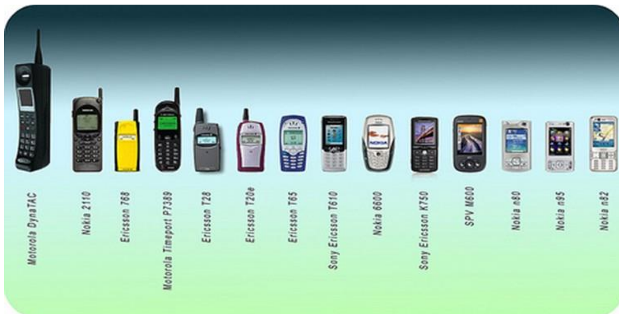
Figura 2: A evolução do aparelho celular