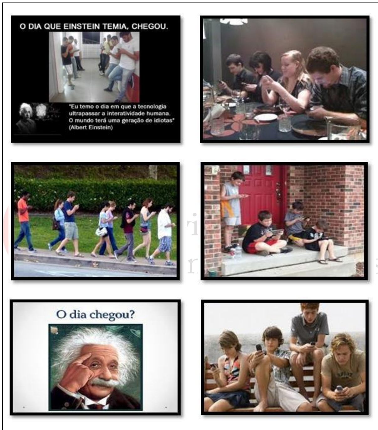
Figura 1: Imagens disponibilizadas para os estudantes

aproximadamente quatro minutos e provocou, entre os estudantes, a reflexão sobre o quanto estamos dependentes do mundo virtual e não nos damos conta disso.