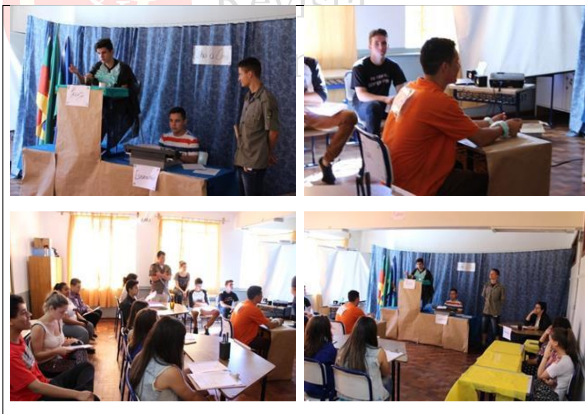
Figura 5: Fotos da peça de teatro

A Figura 5 a seguir ilustra a participação dos alunos no desenvolvimento da atividade.