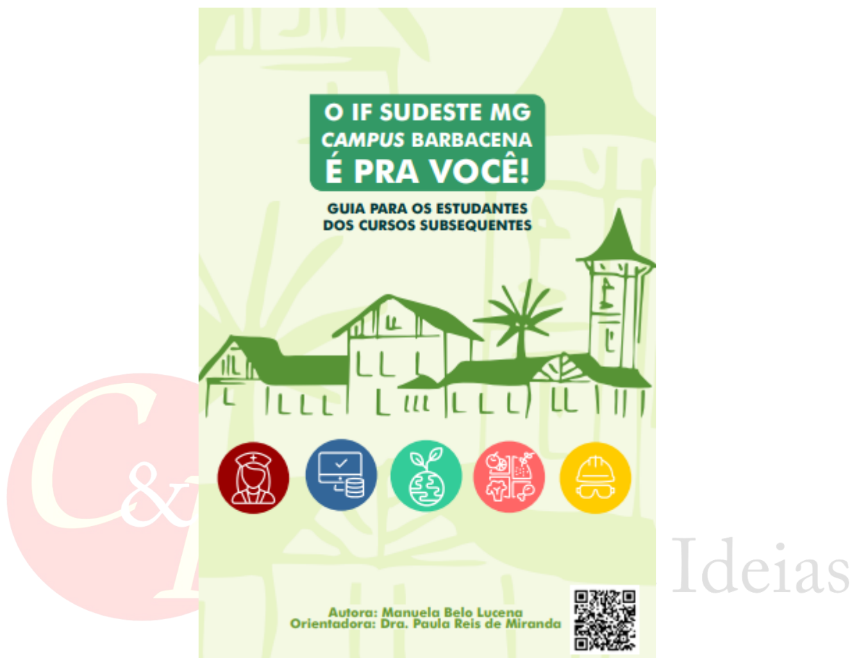
Figura 1: Capa do “Guia para os estudantes dos cursos subsequentes” do IF Sudeste MG- Campus Barbacena.

Ressalta-se que a utilização do QR Code em ambientes educacionais configura-se como um instrumento tecnológico favorável à educação e a tendência é que essa ferramenta seja cada vez mais utilizada no âmbito escolar (RIBAS et al., 2017). Assim, a possibilidade de acesso ao guia pelo QR Code individualizou este produto educacional, fazendo com que ele ganhasse mais destaque.