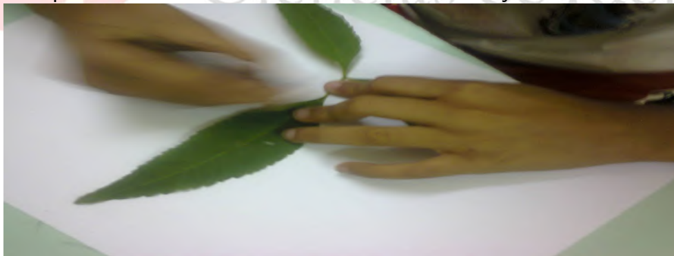
Figura 1: estudante desenhando exemplares de folhas para complementação da atividade.