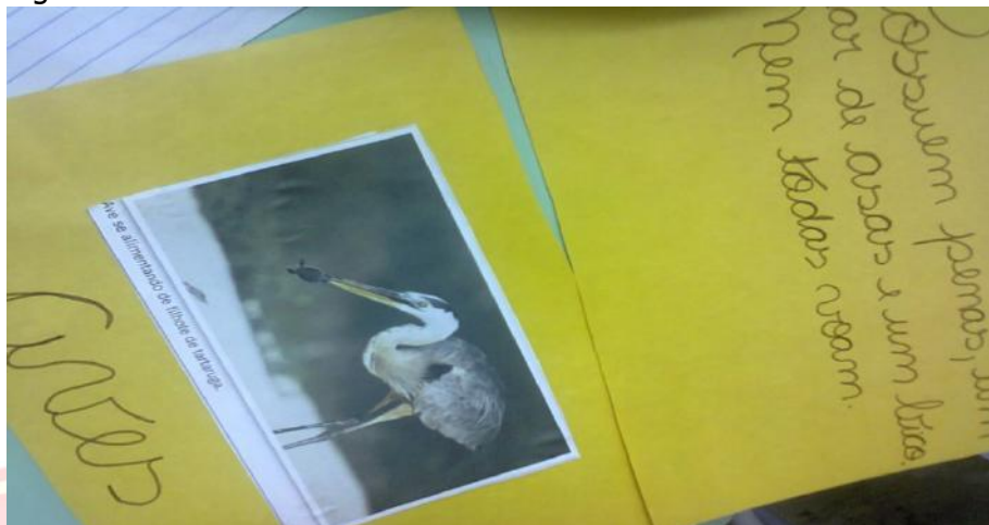
Figura 2: detalhe de jogo da memória.