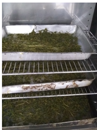
Figura 1. Talos de coentro em estufa de secagem.

As folhas e talos foram postas em fôrmas de alumínio e foram desidratados em estufa com circulação de ar por 4 horas a uma temperatura de 70°C (Figura 1). Após desidratados, folhas e talos, foram trituradas separadamente, com auxílio de liquidificador industrial e, posteriormente, acondicionados em potes de vidro os quais foram guardados em local protegido da luz e umidade, até o início dos experimentos, onde foram submetidas as análises descritas posteriormente.